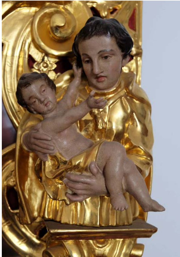
Abbildung 6 Figure 6