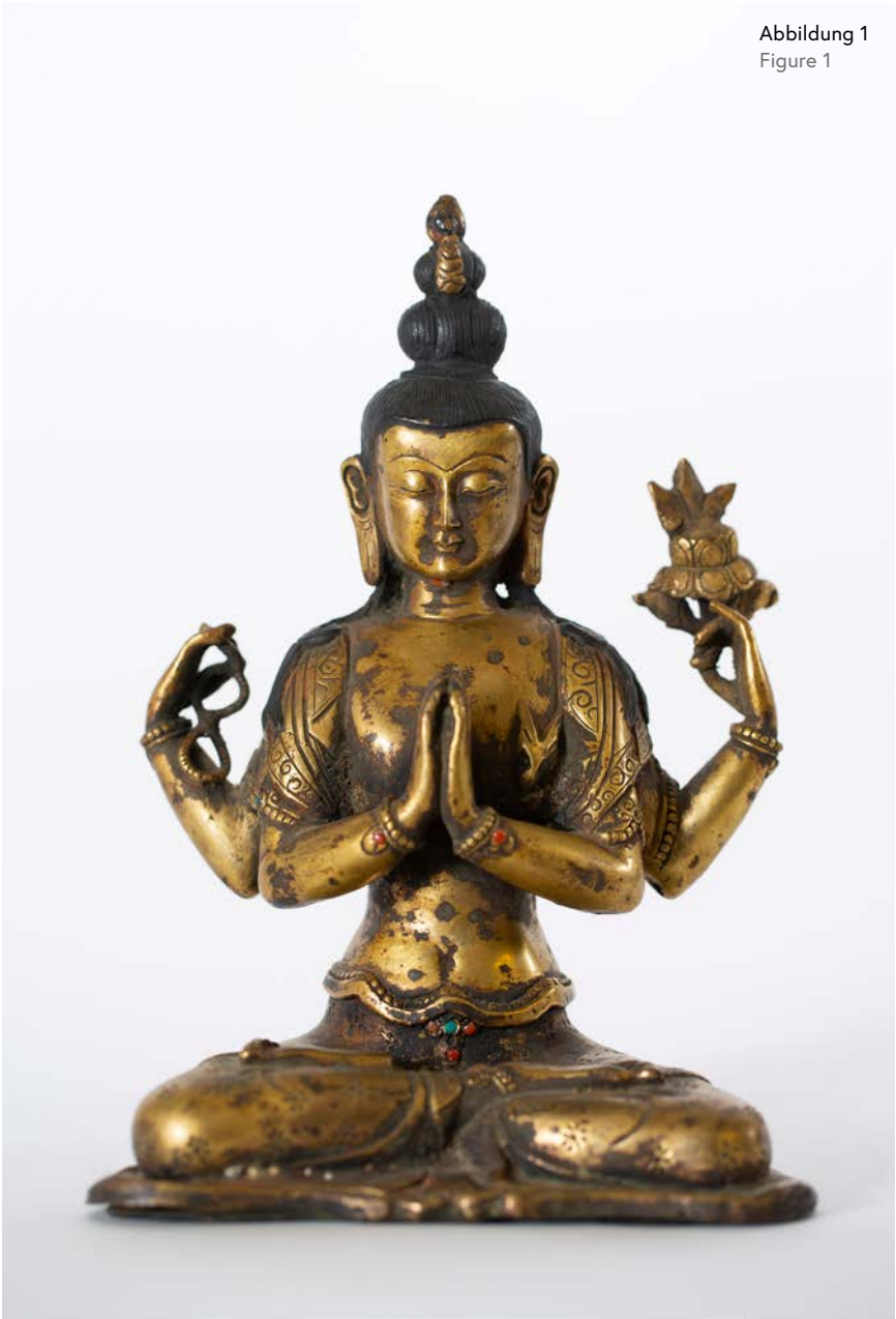
Abbildung 1 Figure 1