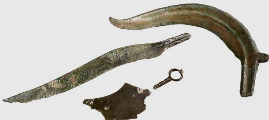
Abbildung 10 Figure 10