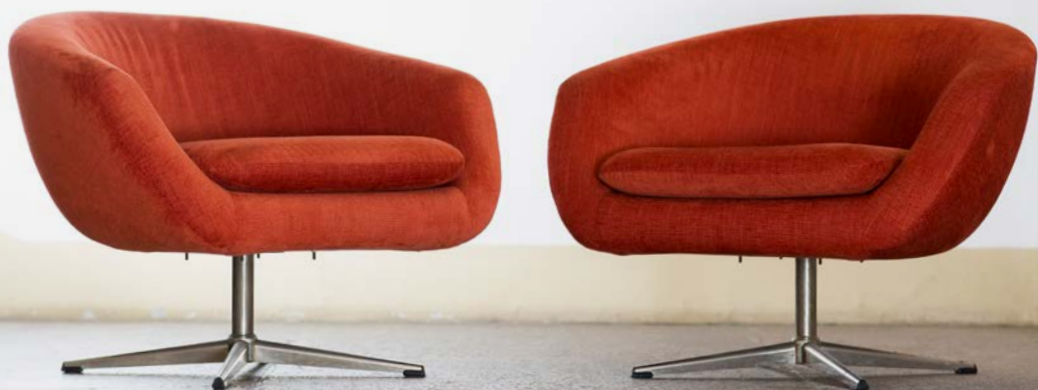
Abbildung 5 Figure 5

Deutsches Zentrum Kulturgutverluste | Lost Art-Datenbank