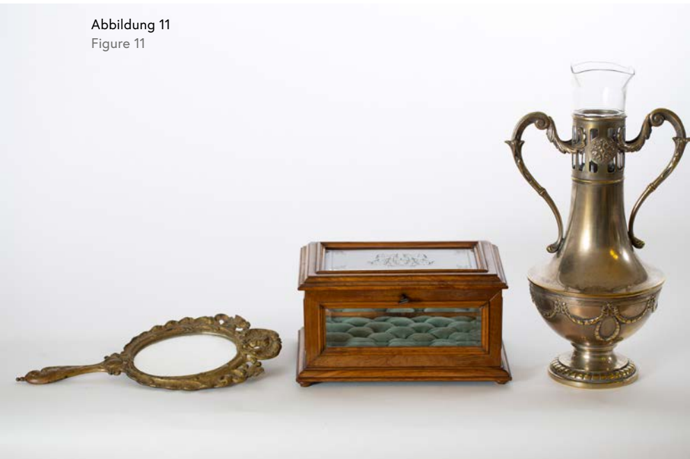
Abbildung 11 Figure 11