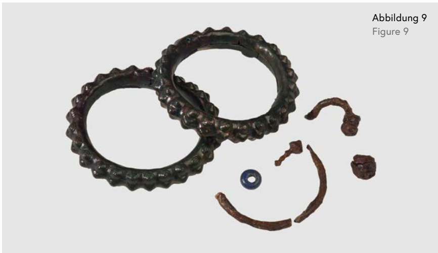
Abbildung 9 Figure 9

German Lost Art Foundation | Lost Art Database