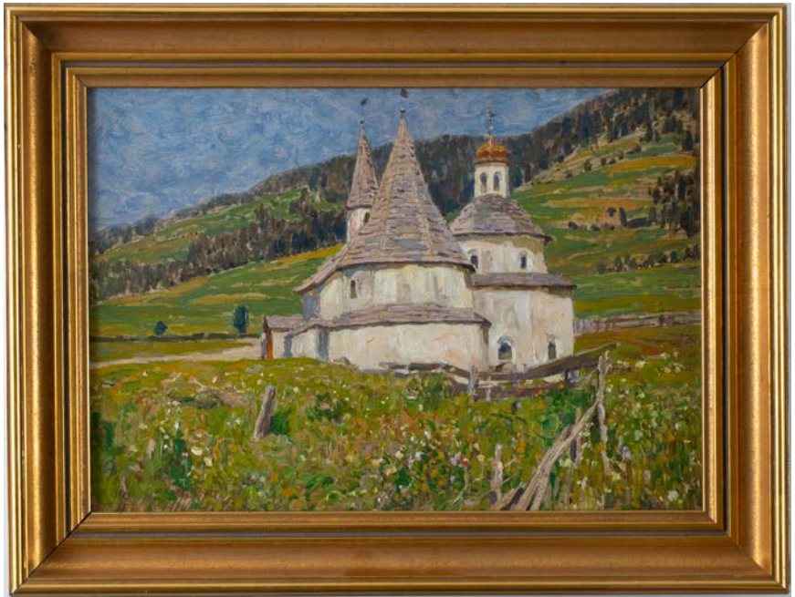
Abbildung 4 / Figure 4

ACHTUNG! Bei Verkauf von Kulturgütern aus einem denkmalgeschützten Objekt ist davon auszugehen, dass auch dessen Inventar bzw. Ausstattung unter Denkmalschutz steht. Der Verkauf von denkmalgeschütztem Inventar /Ausstattung aus einem denkmalgeschützten Gebäude sowie der Verkauf von einzelnen Objekten aus einer denkmalgeschützten Sammlung dürfen nur mit Bewilligung des Bundesdenkmalamtes erfolgen. Ohne Bewilligung ist der Verkauf nichtig!