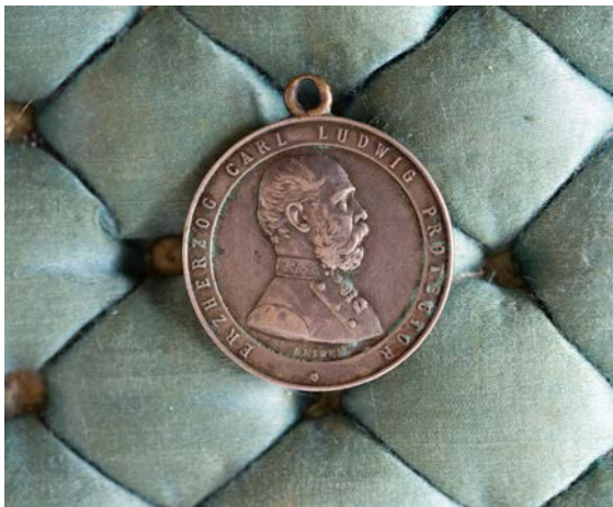
Abbildung 3 Figure 3

ACHTUNG! Bei Ankauf einer gestohlenen Sache von einer Privatperson ist Eigentumserwerb fast nie möglich. Unter Umständen droht auch eine Anzeige wegen Hehlerei! Wenn konkrete Hinweise auf Fremdeigentum vorhanden sind, ist Eigentumserwerb nie möglich. Schon leichte Fahrlässigkeit schließt guten Glauben aus!