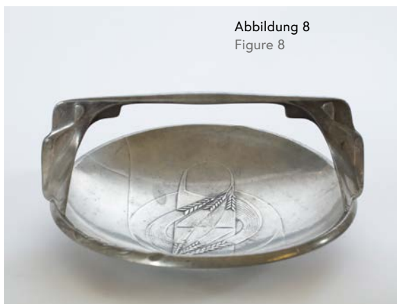
Abbildung 8 Figure 8