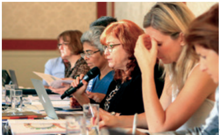
↑ Das Bundeskanzleramt und die Österreichische UNESCO-Kommission waren im September Gastgeber der internationalen UNESCO-Redaktionssitzung zur Finalisierung des zweiten Weltberichts zur Konvention im Bereich „Kulturelle Vielfalt“.

Im September war die Österreichische UNESCO-Kommission gemeinsam mit der Abteilung II/10 des Bundeskanzleramts Gastgeber der ersten UNESCO-Redaktionssitzung zum zweiten Weltbericht zur Konvention. Im Rahmen der Sitzung diskutierten 25 internationale ExpertInnen, eine UNESCO-Delegation sowie VertreterInnen des BKA und der ÖUK über die Umsetzung des neu entwickelten Monitoring-Rahmens zur Erhebung und Bewertung der globalen Umsetzungsfortschritte anhand ausgewählter Indikatoren.